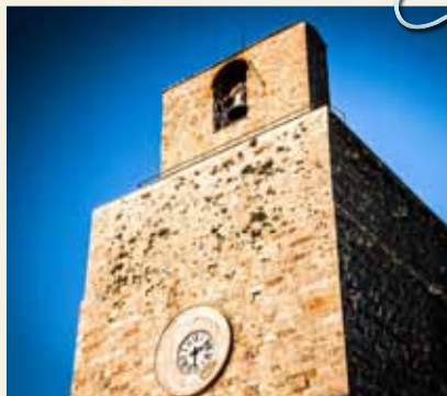
TORRE DEL CANDELIERE